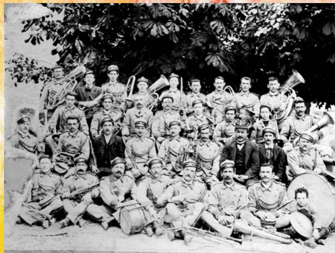
Corpo Musicale Moltrasio (1902)

INGRESSO LIBERO - VI ASPETTIAMO NUMEROSI